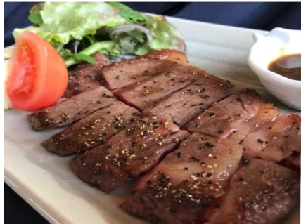
九州産黒毛和牛ステーキ定食 ¥2000 九州産黒毛和牛ステーキ 小鉢、汁物、漬物、ミニデザート