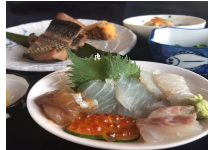
大人様ランチ ¥1300 Sashimi and grilled fish set meal ミニ刺身、ミニ焼き魚、御飯、小鉢、汁物、 漬物、ミニデザート