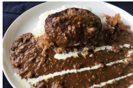
手作りハンバーグカレー ¥1000 Hamburg steak Curry rice & Soup (汁物付き) ※カレーライス単品 ¥700