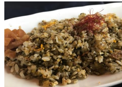
能古島高菜チャーハン ¥700 Fried rice & soup (汁物付き)