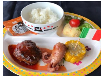
お子様ランチ ¥600 Children Lunch (ミニジュース・オマケ付き)