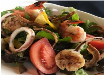
シーフードサラダ ¥1000 Seafood salad シーフードをグリルしてマリネしたサラダ