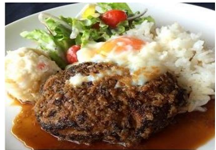
和風ノコモコランチ ¥1000 Loco moco Japone sauce & soup ジャポネソースのロコモコプレート、 汁物、ミニデザート