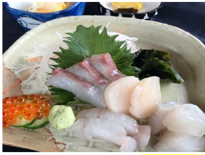
刺身定食 ¥1300 【数量限定】 Sashimi set meal 刺身、小鉢、御飯、汁物、漬物、 ミニデザート