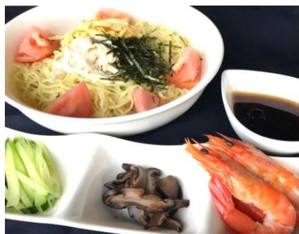
冷やし中華 ¥850 Cold Chinese noodles 冷やし中華、ミニデザート