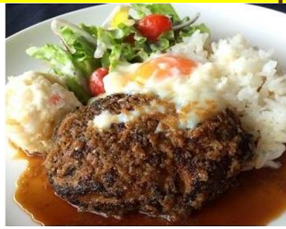
和風ノコモコランチ ¥1000 Loco moco Japone sauce & soup ジャポネソースのロコモコプレート、汁物、ミニデザート