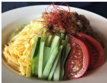
ジャージャー麺 ¥850 Zhajiangmian ジャージャー麺、ミニデザート