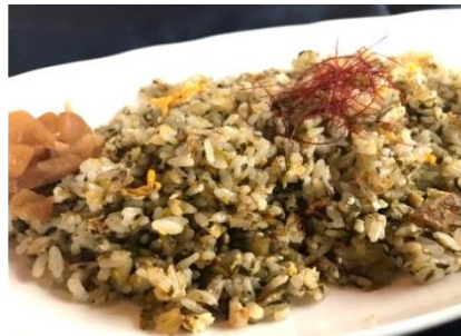
能古島高菜チャーハン ¥700 Fried rice & soup (汁物付き)