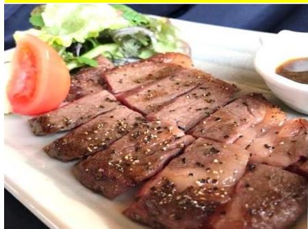
九州産黒毛和牛ステーキ定食 ¥2000 九州産黒毛和牛ステーキ 小鉢、汁物、漬物、ミニデザート