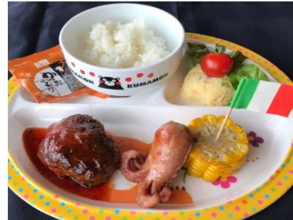
お子様ランチ ¥600 Children Lunch (ミニジュース・オマケ付き)