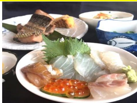
大人様ランチ ¥1300 Sashimi and grilled fish set meal ミニ刺身、ミニ焼き魚、御飯、小鉢、汁物、漬物、ミニデザート