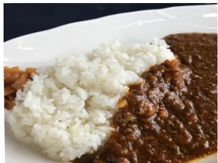
カレーライス ¥700 Curry rice & Soup (汁物付き)