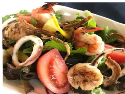
シーフードサラダ ¥1000 Seafood salad シーフードをグリルしてマリネしたサラダ