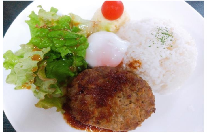
ノコモコランチ 1000円