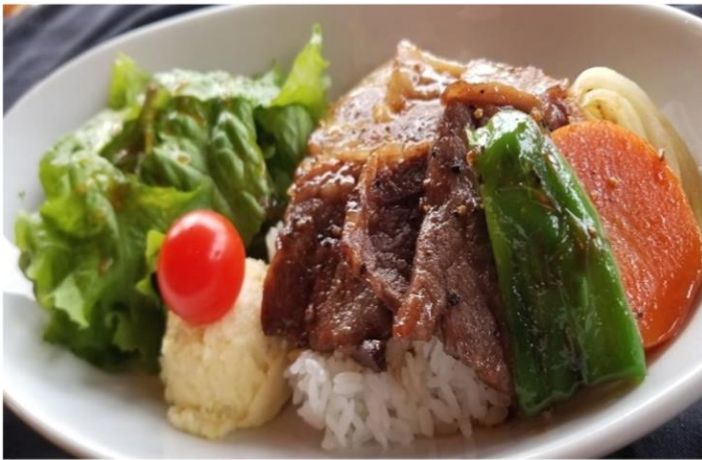
スタミナ焼肉丼 1200円