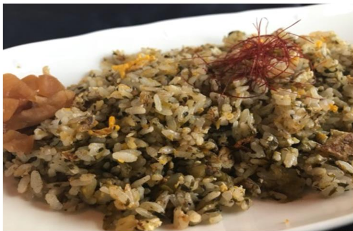
自家製高菜チャーハン 700円